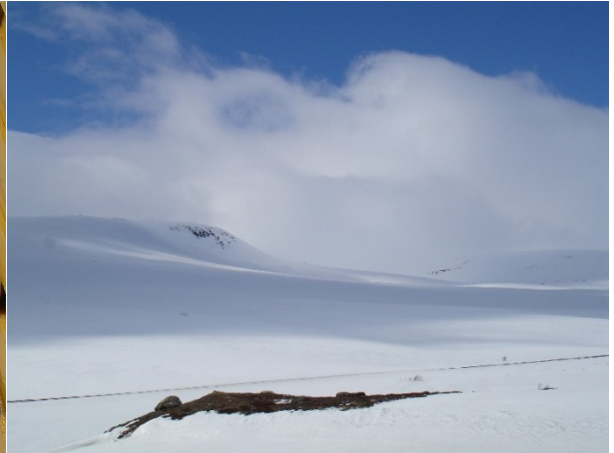
Forberedt på å tåle en kuling...