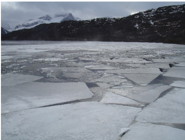
Is som smelter - brudd eller ny mulighet?