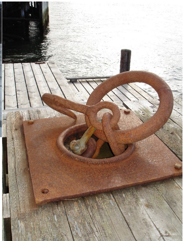
fremdeles holdbart feste